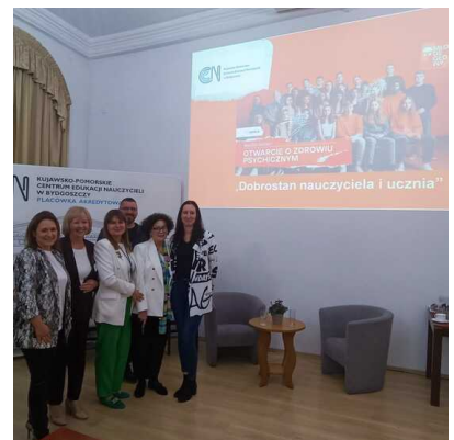
Organizatorki i prelegenci