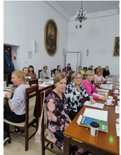
Uczestnicy konferencji (1)