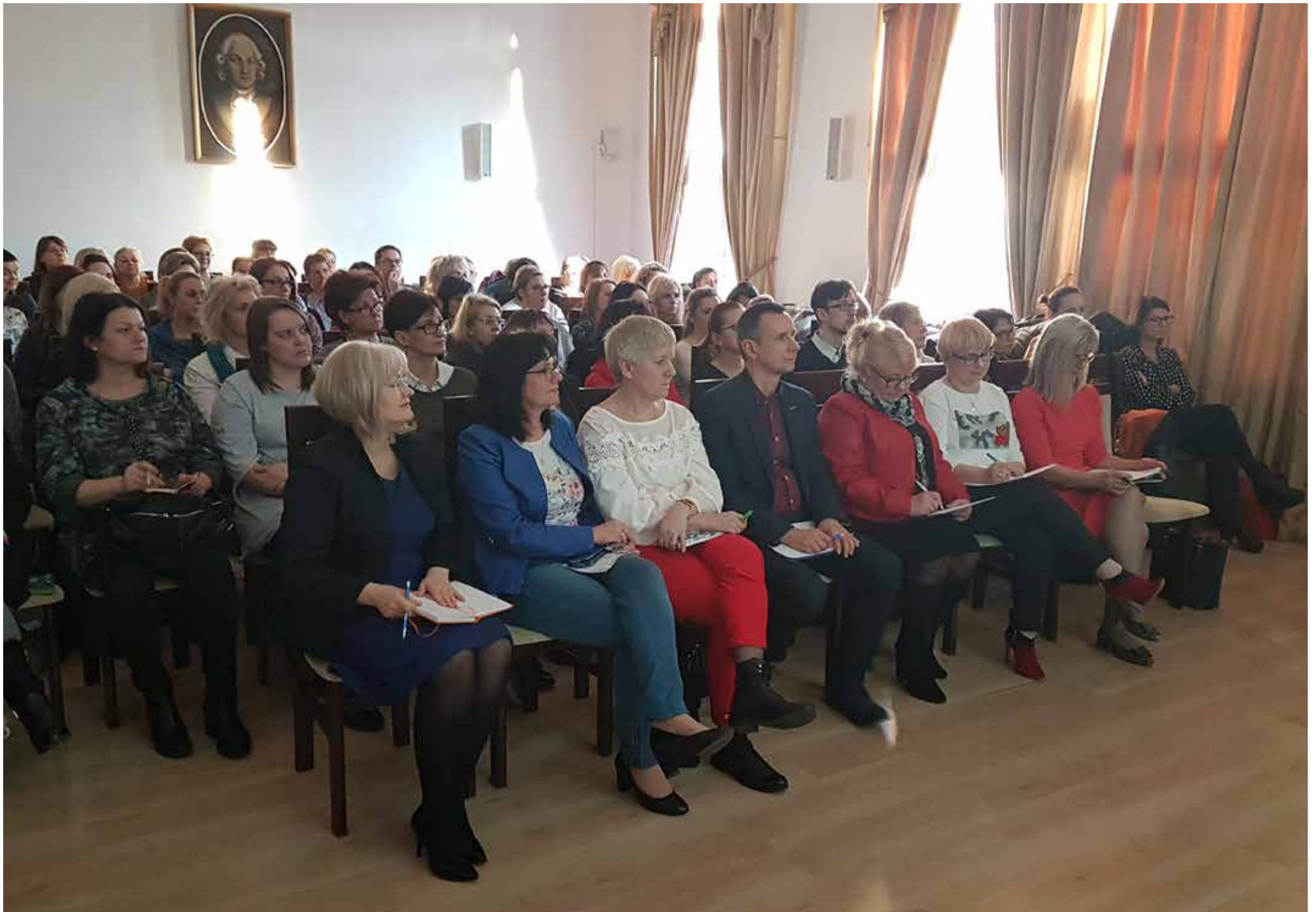
Wykład cieszył się dużym zainteresowaniem